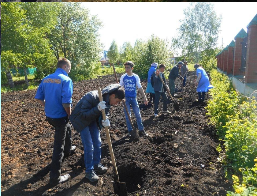
Ежегодная экологическая акция «Посади дерево»