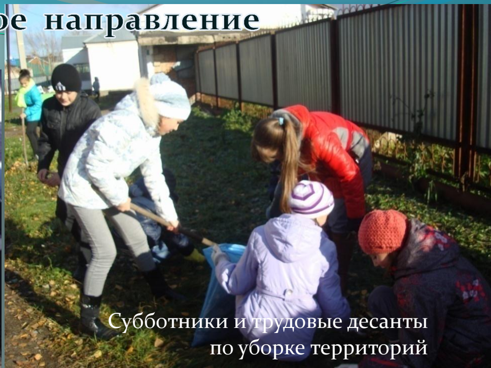
Субботники и трудовые десанты по уборке территорий