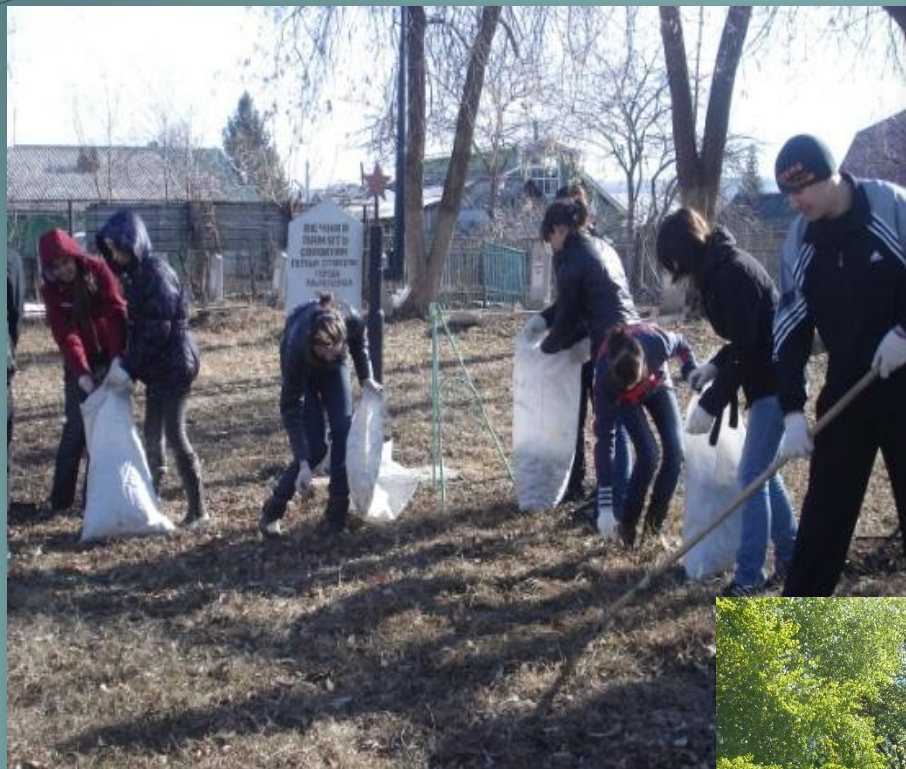
Благоустройство памятников культуры