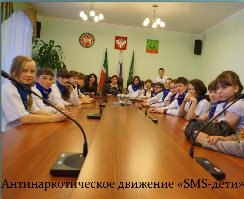
Антинаркотическое движение «SMS-дети»

Члены союза с уважением относятся к убеждениям, добрым и полезным делам других детских организаций и движений.